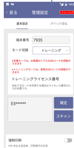
「スキャン」をタップ