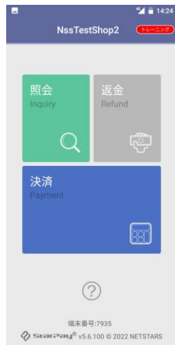
画面下の「?」をタップ

※照会画面のブランド選択に表示されるブランドが利用可能ブランドです。 →StarPay-Worksでも同内容が確認できます。