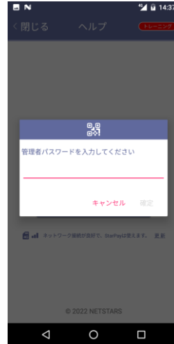
管理者パスワードを [00112233]入力