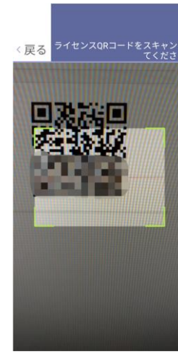
該当店舗のQRコード をスキャン