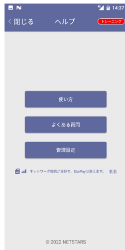
「管理設定」をタップ